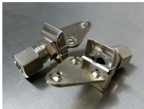
Adaptadores para montaje en panel