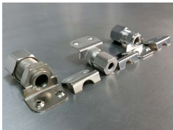
Adaptador para tubing y cable

Series: AC, ARMP, AM, AT y ATD Adaptadores