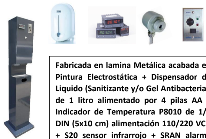
DGT - 05W

Fabricada en lamina Metálica acabada en Pintura Electroestática + Dispensador de Líquido (Sanitizante y/o Gel Antibacterial) de 1 litro alimentado por 4 pilas AA + Indicador de Temperatura P8010 de 1/8 DIN (5x10 cm) alimentación 110/220 VCA + S20 sensor infrarrojo + SRAN alarma remota.