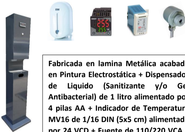
DGT - 02W

Fabricada en lamina Metálica acabada en Pintura Electroestática + Dispensador de Líquido (Sanitizante y/o Gel Antibacterial) de 1 litro alimentado por 4 pilas AA + Indicador de Temperatura MV16 de 1/16 DIN (5x5 cm) alimentado por 24 VCD + Fuente de 110/220 VCA a 24 VCD + S20 sensor infrarrojo.