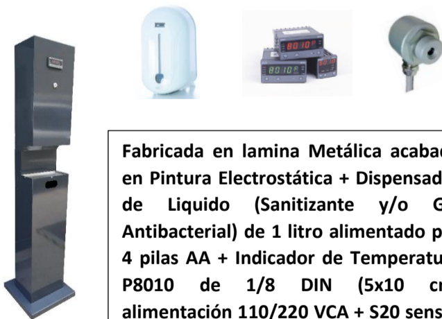
DGT - 04W

Fabricada en lamina Metálica acabada en Pintura Electroestática + Dispensador de Líquido (Sanitizante y/o Gel Antibacterial) de 1 litro alimentado por 4 pilas AA + Indicador de Temperatura P8010 de 1/8 DIN (5x10 cm) alimentación 110/220 VCA + S20 sensor infrarrojo.