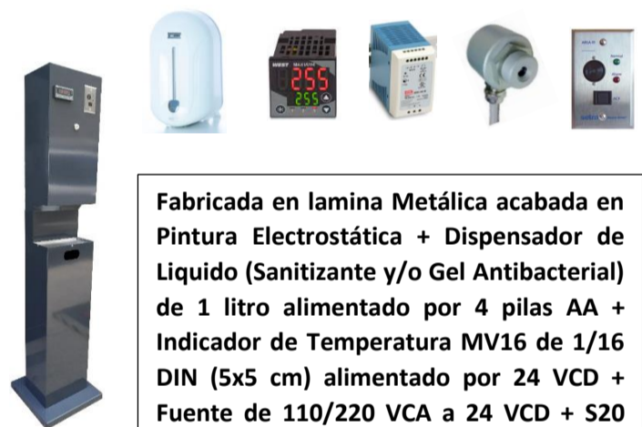
DGT - 03W

Fabricada en lamina Metálica acabada en Pintura Electroestática + Dispensador de Líquido (Sanitizante y/o Gel Antibacterial) de 1 litro alimentado por 4 pilas AA + Indicador de Temperatura MV16 de 1/16 DIN (5x5 cm) alimentado por 24 VCD + Fuente de 110/220 VCA a 24 VCD + S20 sensor infrarrojo + SRAN alarma remota.