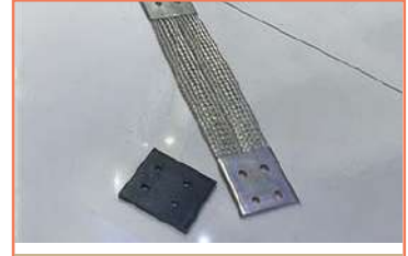
Corte Laser A36 Placa 3/8 Y Maquinado (Machuelos) Fresadora CNC (Xd-40a)