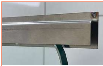
Corte Y Doblez Moldura Para Loseta En Ai304 Calibre 20 + Soldadura -pulido Soldadura Tig-Mig-Eléctrica