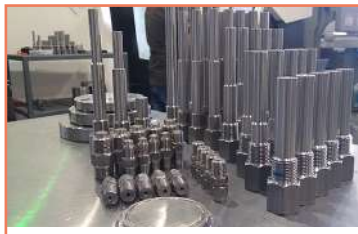
Termopozos Tornos CNC ( CLX-450 + ST20Y + ST15)