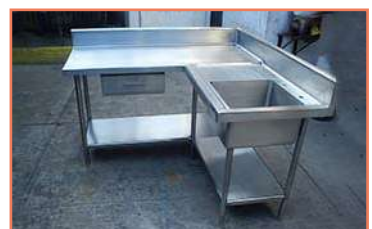
Mobiliario de Cocinas Soldadura Tig-Mig-Eléctrica