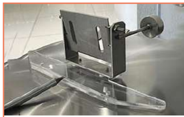
Péndulo Completo + Soldadura Tig-Mig-Eléctrica