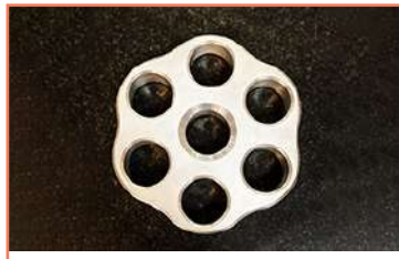
Barril En Ai304 Fresadora CNC ( XD-40A )