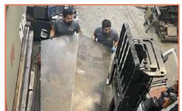
Doblez Extragrande En Placa A36 De 1/4 Doblez Cnc Accurpress