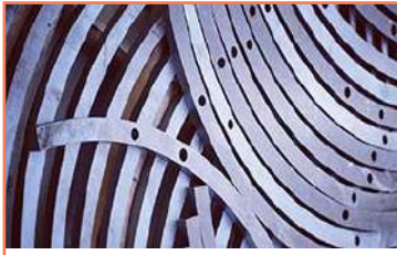
Corte De Sellos En A36 Placa De 5/8 Corte En Acero Al Carbón A36