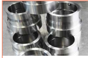
Buje En Ai316 Tornos CNC ( Clx-450 + St20y + St15)