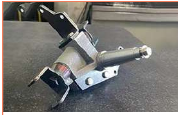
Torre De Bicicleta + Doblez Doblez CNC Accurpress