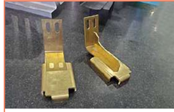
Cl + Doblez Soportes En Laton Placa 3/16 Corte En Latón