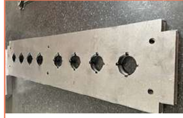
Corte En A36 Lámina Calibre 14 Corte En Acero Al Carbón A36