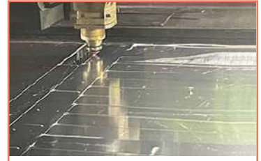
Corte En Lámina De Aluminio Corte En Aluminio