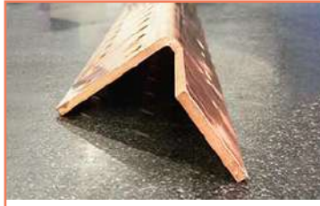
Cl + Doblez De Tiras En Cobre Placa 3/8 Corte En Cobre