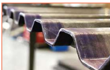
Doblez Laminación En Placa A36 De 3/16 Doblez CNC Accurpress