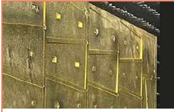
Corte En Placa De 1_4 En Latón Corte De Latón