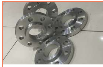
Maquinado De Bridas ( En Aluminio ) Centro De Maquinado Cnc (Vf-3ss)