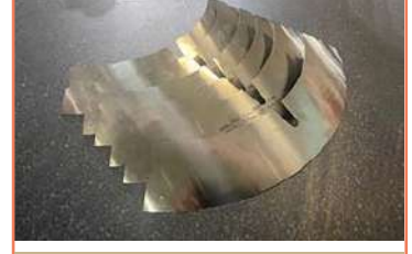
Micro Corte En Fleje ( En Ai303 Espesor De 0.305 Mm) Corte En Acero Inoxidable