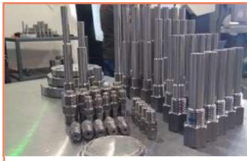
Bridas y Niples Fresadora CNC (XD-40A)