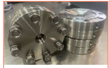
Sellos Quimicos Centro de Maquinado CNC (VF-3SS)