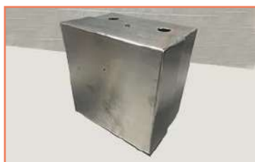
Caja De Ai304 En Cal 18 Corte + Doblez + Soldadura Y Pulido Soldadura Tig-Mig-Eléctrica