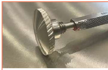
Chapetón En Acero Inoxidable 304 Tornos CNC ( Clx-450 + St20y + St15)