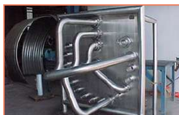
Conexiones Sanitarias Soldadura Tig-Mig-Eléctrica