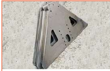
Corte De Celosía En Galvanizado Calibre 18 + Doblez Corte En Acero Al Carbón A36