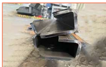
Doblez De 3 Pestañas Extralargo En Placa A36 De 1/4 Doblez CNC Accurpress