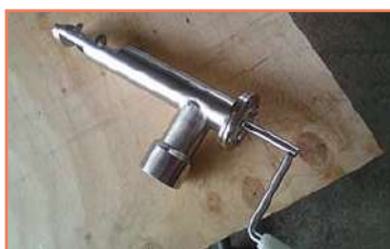
Accesorios Para Carnes Frias Soldadura Tig-Mig-Eléctrica